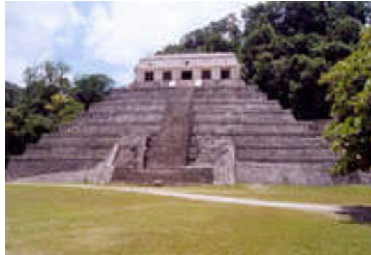
Temple des inscriptions

Inscrit au Patrimoine Mondial (1987) – Site archéologie au nord des collines du Chiapas, dans les forêts.