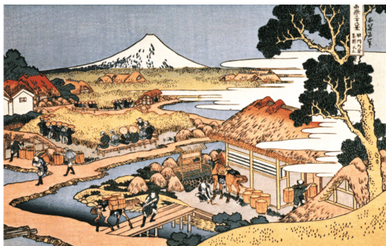
Vue d'une plantation