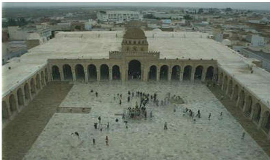
Vue sur la salle de prière

Cité moderne – Minaret en brique côté nord, 30m de hauteur – Cour, oratoire, nef centrale – 17 nefs à toit plat – 414 colonnes monolithiques soutiennent le toit plat – 4 travées dans la salle de prière qui s'ouvre sur la cour avec 13 arcs.